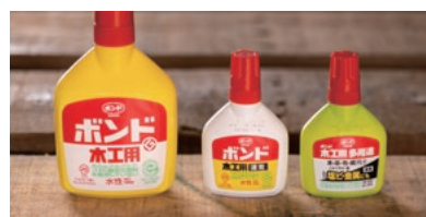
ボンド物流株式会社 会社概要 / 2012年創業。 木工用接着剤「ボンド」でおなじみのコニシ株式会社が製造する商品の保管・物流を担う会社。栃木物流センターと滋賀物流センター、東西に2拠点を構える。

給水などの操作が容易な点、ノンフロンで環境にやさしい点にも満足しています。点数をつけるとしたら、さらなる性能向上という今後の伸びしろに期待して、10点満点中8点!働き方改革の事例として他社に同製品を紹介したことがあります。まだまだ知らない方が多いと思うので、これからも発信していきたいですね。「PureDrive-FL」には、物流の現場をもっと改善してくれる力があると信じています。